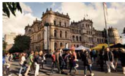
布里斯班农贸市场